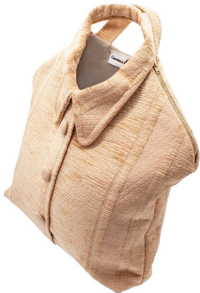
Rosa cipria a righe - Cerniere beige - Fodera beige