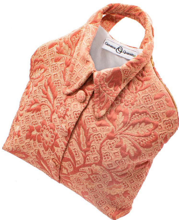
Pesca e beige floreale - Cerniere arancioni- Fodera beige