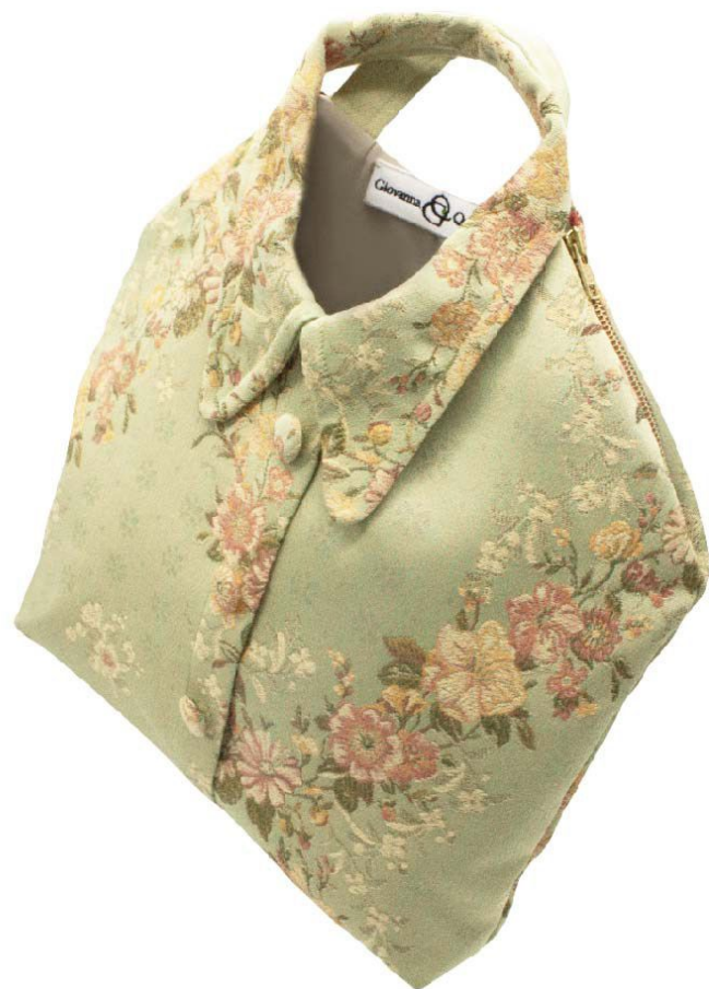
Té verde floreale - Cerniere arancioni - Fodera beige