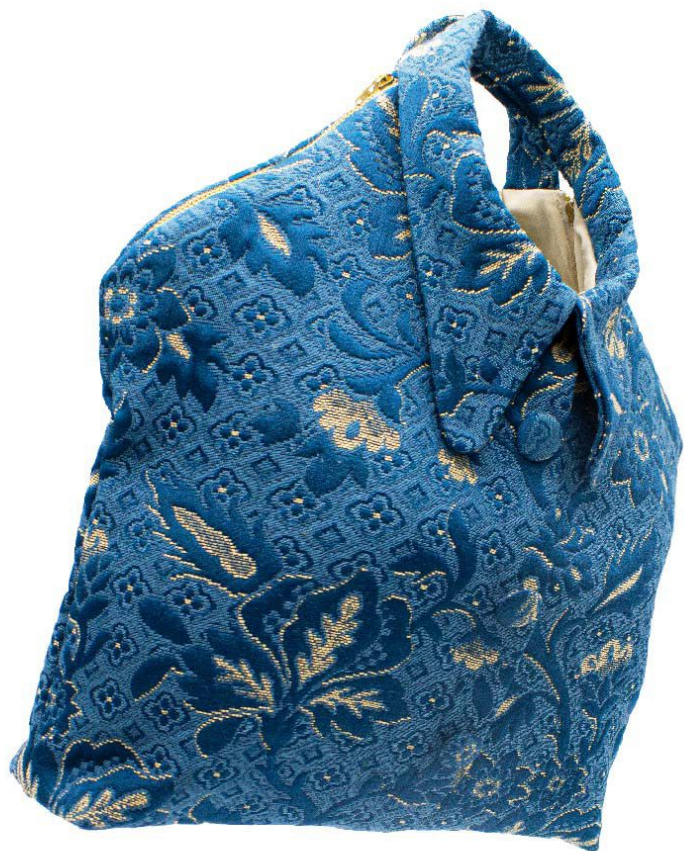
Blu Ottanio e beige floreale - Cerniere beige - Fodera Beige