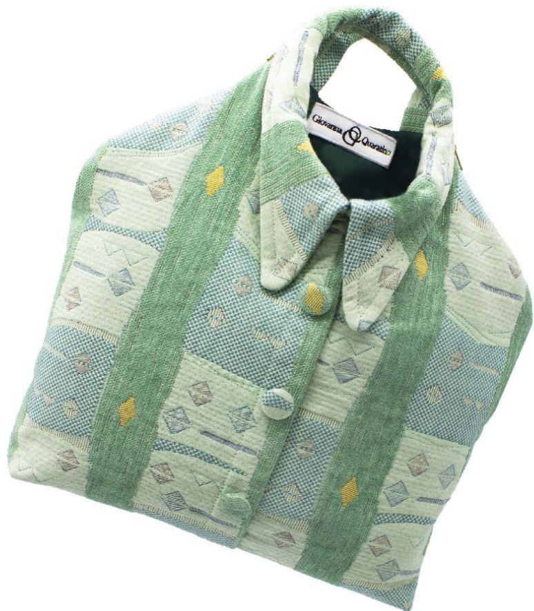
Fantasia varianti verde - Cerniere beige - Fodera beige